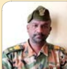
مفده مخببات / محمد الفلاح بدوي

آدم عليه السلام وان الله تعالى عندما ادخله الجنة امره بان لا يأكل من تلك الشجرة ولكن كان مدخل ابليس لاقناع ابونا آدم هي رغبته في الخلود فقال له ان اكلت من تلك الشجرة فهي شجرة الخلد فخالف ابونا آدم الامر الرباني وكان العقاب الطرد من الجنة وكذلك فرعون وصل