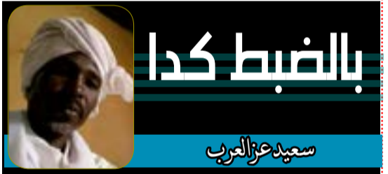
بالضبط كدا سعيد عز العرب

جيش السودان يكفي العنوان لا طاطا الراس في يوم مهزوم لا خيب ظن لا باع لا خان في السلم عمار زي إبناً بار في الحرب بزمر زي بركان بكسح ويمسح زي الطوفان بي دم أولادو وأرواحم بنعم سوداننا سلام وأمان جيشاً ضارب عمق التاريخ مافيهو هويتين ولا جبان دافع عن بلدوا وعن شعبوا أبدأ ماإتراجع، لا يوم لان تاريخ مليون قوة وعزة تاريخ مغفور فخر وإيمان وجيش السودان يكفي العنوان # سرالختم_السالمابي