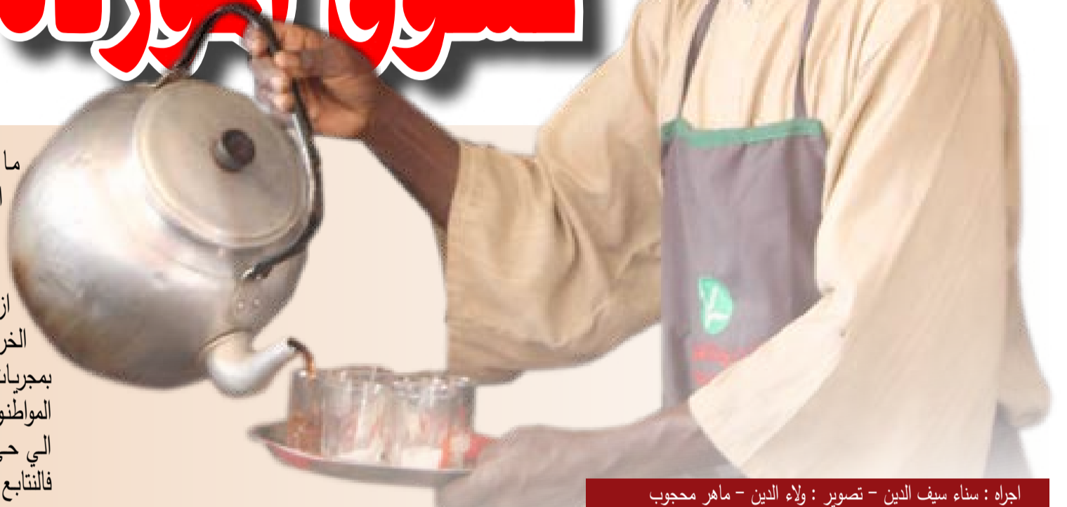
اجراه : سناء سيف الدين

ما تزال كاميرا ( صحيفة كرري ) تواصل توثيقها المستمر لعودة المواطنين الي منازلهم بامدرمان القديمة بعد تطهيرها من مليشيا ال دقلو الارهابية .. لترصد عودة الحياة تدريجياً الي طبيعتها وجهد المواطنين في ازالة مخلفات الحرب من منازلهم ومواصلة حكومة ولاية الخرطوم في اعادة الخدمات الي تلك المناطق المتأثرة بمجريات الحرب كذلك رصد الانتهاكات التي تعرض لها المواطنون من متمردي مليشيا ال دقلو الارهابية ، قمنا بزيارة الي حي الموردة الامدرماني العريق وخرجنا بهذه الحويلة فالنتابع :-