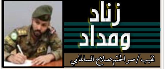
زناد وهداد تقيب / سرالختم صلاح السالمابي